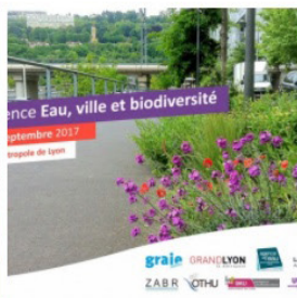
Conférence « Eau, ville et biodiversité » Mardi 26 septembre 2017 à l'Hôte...