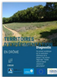
TVB urbaine et péri-urbaine - Expérimentation diagnostic - 20 juin