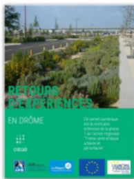
TVB urbaine et péri-urbaine - Retours d'expériences en Drôme