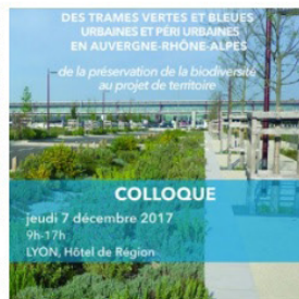
REGARDS CROISÉS MISE EN OEUVRE DES TRAMES VERTES ET BLEUES URBAINES ET PÉRI...