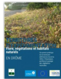
FLORE, VÉGÉTATIONS ET HABITATS NATURELS