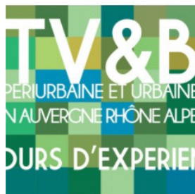
Fiches retours d'expériences - Trame Verte et Bleue Urbaine et péri-urbaine...