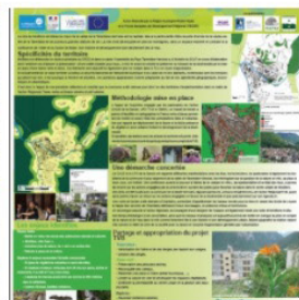
MOÛTIERS, UNE EXPERIMENTATION TRAME VERTE ET BLEUE EN TERRITOIRE CONTRAINT